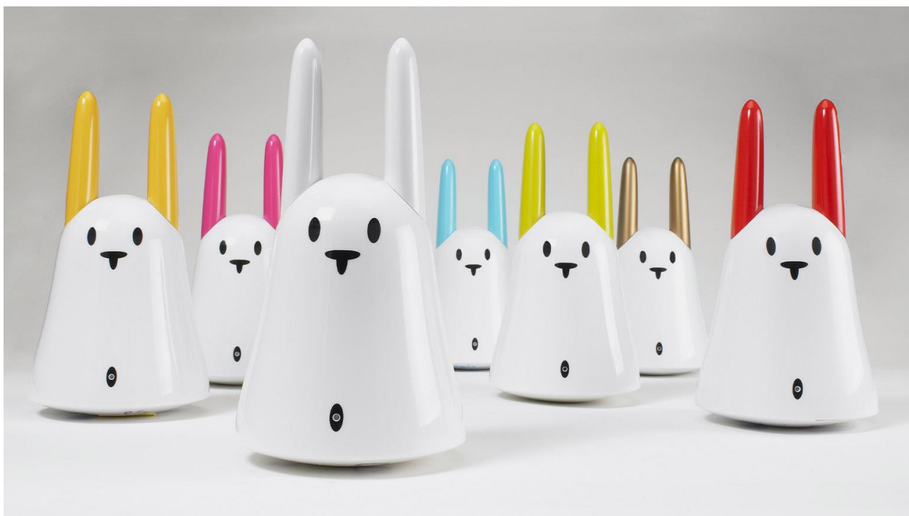
Рисунок 1 – Прототип умной колонки